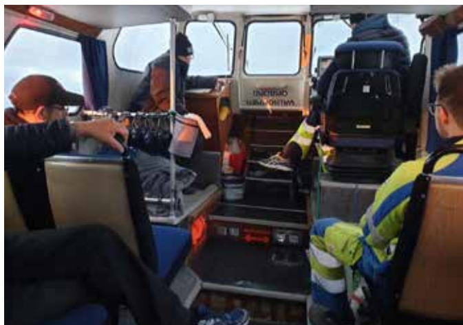
Båten Gajecha trafikerar Luleå skärgård när det är isfritt, sen gäller isvägarna, foto: Erika Hansson.