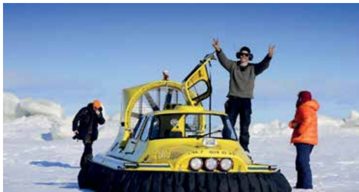
Svävartrafik i Luleås skärgård, foto: Kent Nyberg, Condor Shipping.

sinkostnaderna. Alla leder prickas med granruskor eller pinnar, så att man lätt kan hitta även i dimma och snö.