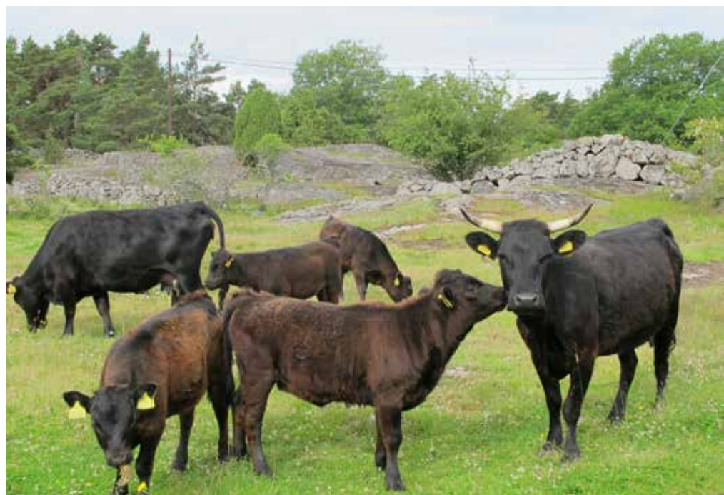
Miljöarbetande Dexterkor i Sankt Anna skärgård