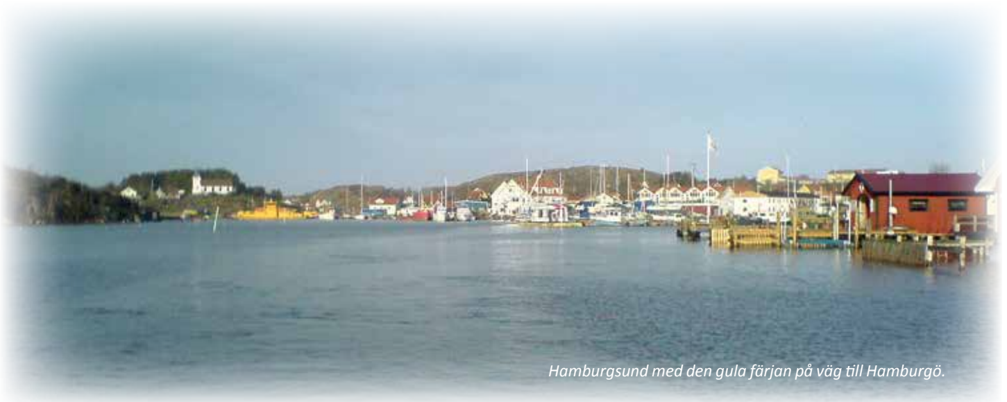
Hamburgsund med den gula färjan på väg till Hamburgö.