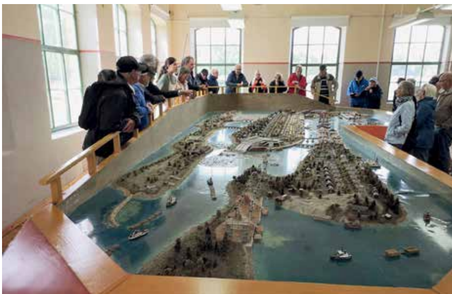
I museet finns denna modell. Närmast ser man ön med rader av arbetarbostäderna.