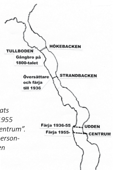
Färjelägena har flyttats genom åren och år 1955 flyttades läget till "Centrum". Färjan som tog sex personbilar trafikerade leden fram till 1971.