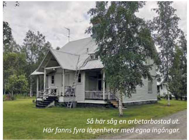
Så här såg en arbetarbostad ut. Här fanns fyra lägenheter med egna ingångar.

I ett tidigare nummer av Vi Skärgårdsbor (nr 3-2019) berättade jag om Peckas tomater, som var ett av våra stopp på Söderhamns kust- och skärgårdsförenings museiresa sommaren 2019. Ett annat stopp som etsade sig fast i minnet var besöket på Norrby skär.