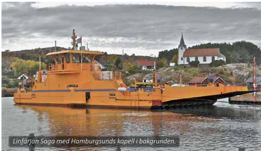
Lin färjan Saga med Hamburgsunds kapell i bakgrunden.