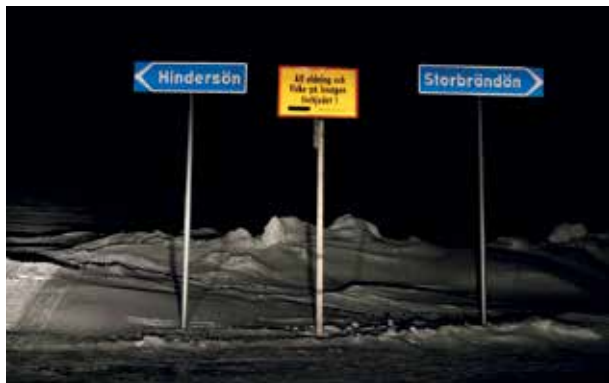
Vägskäl en bit ute på isen, foto: Åsa Nilsson.