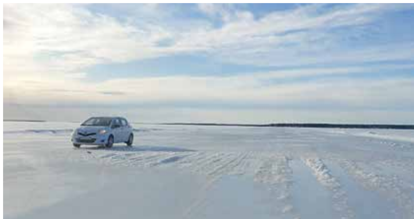
På väg till Hindersön

Det finns fyra isvägar i Luleå skärgård och de brukar öppna under januari eller i början av februari. Men vissa år blir det inga isvägar alls.